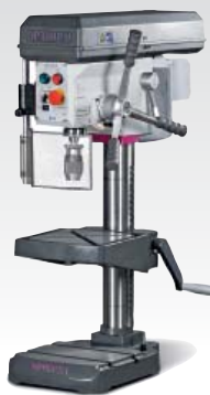
Kép: B 24 H