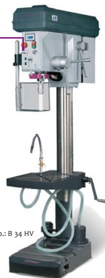
Kép.: B 34 HV