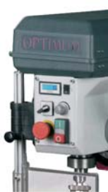
Kép.: B 24 HV