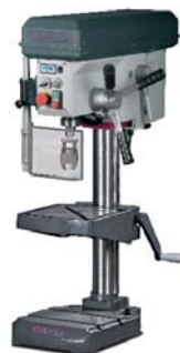
Kép.: B 28 HV