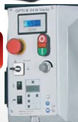
Kép.: B 34 HV