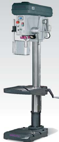
Kép: B 28 H